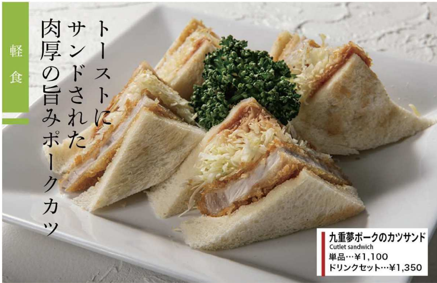
九重夢ポークのカツサンド Cutlet sandwich 単品…¥1,100 ドリンクセット…¥1,350