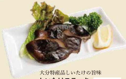
大分特産品しいたけの旨味 しいたけステーキ ¥600