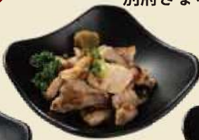
西京味噌の香ばしい風味がたまらない 豚の西京焼き ¥500