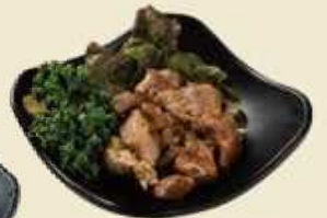
大分銘柄どり冠地鶏一味違う岩塩焼き 冠地鶏の岩塩焼き ¥600