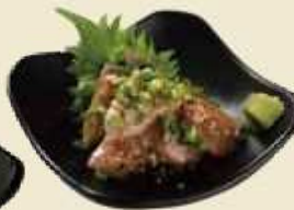
大分の郷土料理りゅうきゅう ぶりのりゅうきゅう ¥600