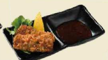
サクサクの食感 鱧カツ ¥500

※写真はイメージです。お皿や盛り方が異なる場合がございます。※小鉢、漬物は季節により変わります。