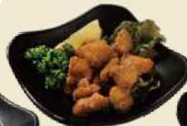
ビールによく合うおつまみでナ なんこつ唐揚げ ¥400