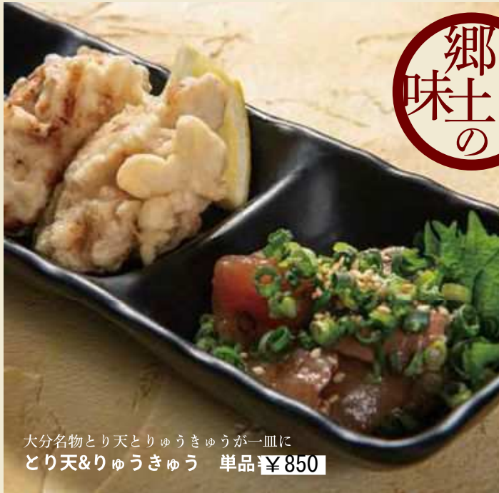
大分名物とり天とりゅうきゅうが一皿に とり天&りゅうきゅう 単品 ¥850