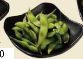
定番のおつまみ!! 枝豆 ¥350