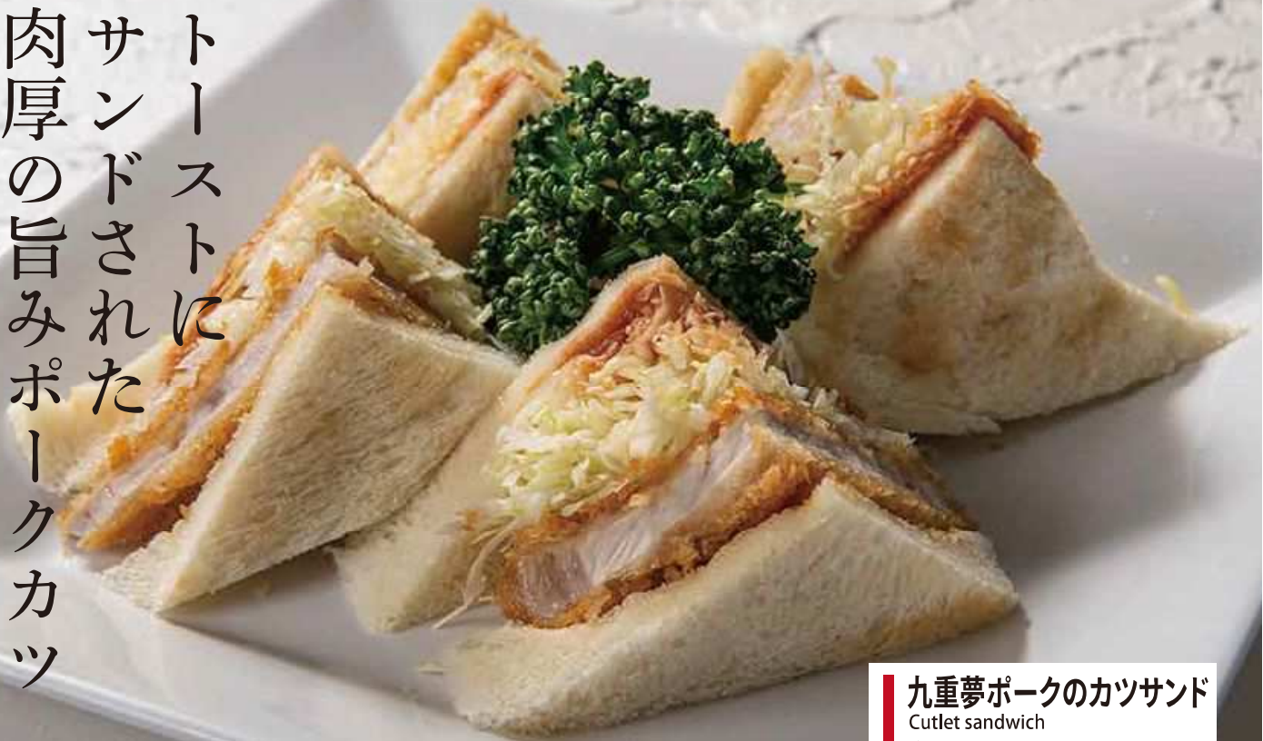
九重夢ポークのカツサンド Cutlet sandwich 単品…¥1,100 ドリンクセット…¥1,350