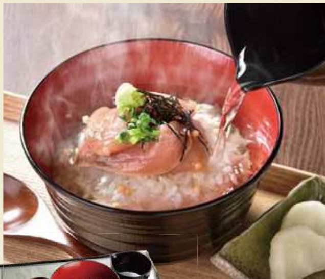
大分郷土料理のお茶漬け ブリのりゅうきゅう茶漬け ¥800