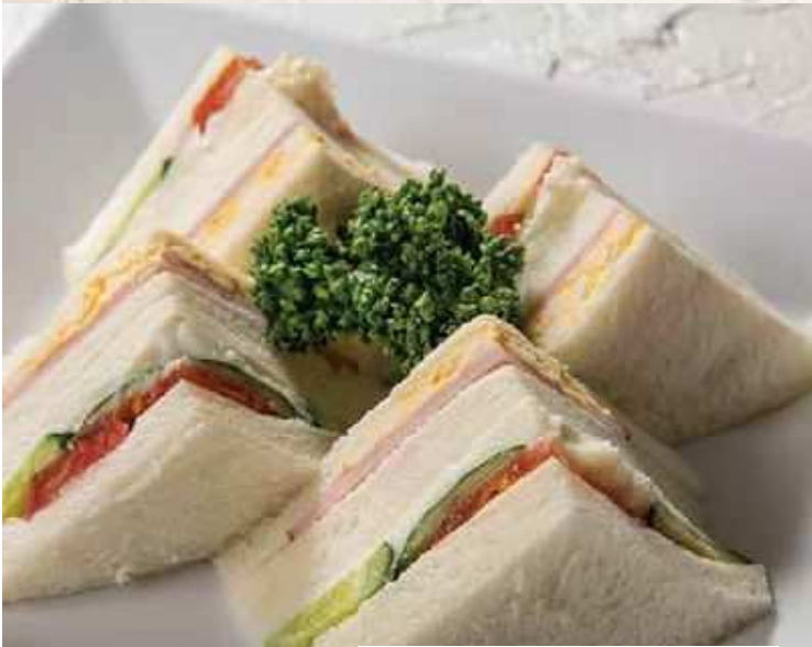
ミックスサンド Mixed sandwich 単品…¥900 ドリンクセット…¥1,150