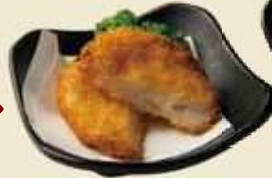
魚のすり身コロッケ 別府ぎょりん ¥400