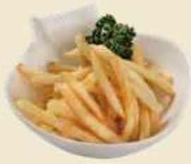
定番のおつまみ、お子様にも大人気 フライドポテト ¥450