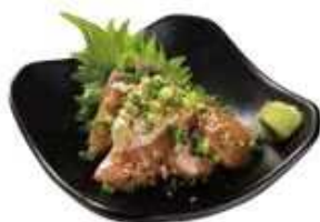
ブリのりゅうきゅう … ￥600