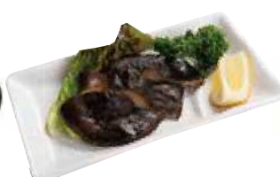
しいたけステーキ … ￥600