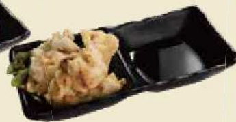
大分庶民の家庭の味 とりの天ぶら ¥500