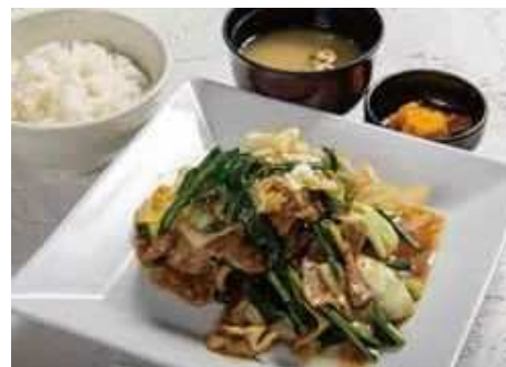
大分市発祥のいな豚定食 … ￥1,100