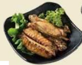
大分銘柄どり冠地鶏一味違う岩塩焼き 冠地鶏手羽中の岩塩焼き ¥600