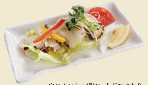
白ワインと一緒にいかがですか？ タコのマリネ ¥850