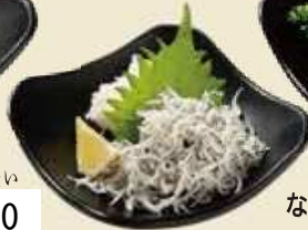
カルシウムたっぷり美味しいちりめん おろしちりめん ¥450