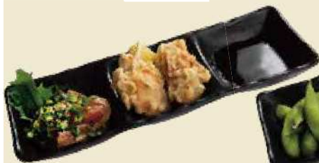
大分名物とり天とりゅうきゅうが一皿に とり天&りゅうきゅう ¥850