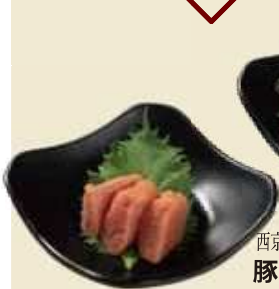
かぼす風味の粒立ち明太子 かぼす明太子 ¥550