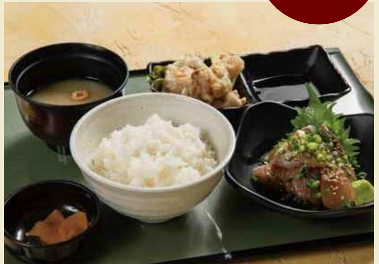
例 ブリのりゅうきゅう+とり天おつまみ+ご飯セット