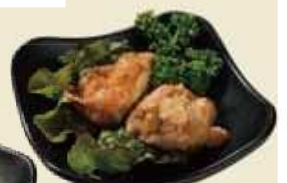
唐揚げの本場大分の唐揚げ からあげおつまみ ¥500