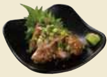
ブリのりゅうきゅう ¥600