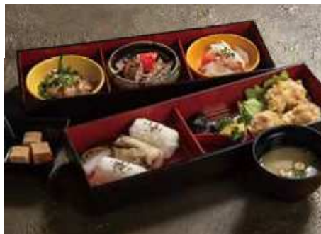
大分名物満載 味力御膳 みりょく … ￥2,300