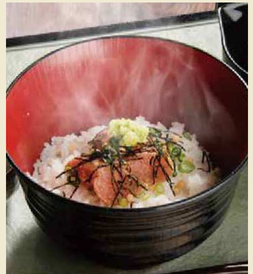
九州名物明太子を炙りました やまや特製 炙り明太子茶漬け ¥800