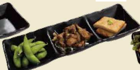
おつまみの定番が一皿に おつまみ3点セット ¥650