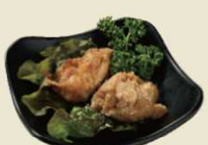
唐揚げの本場大分の唐揚げ からあげおつまみ ¥500