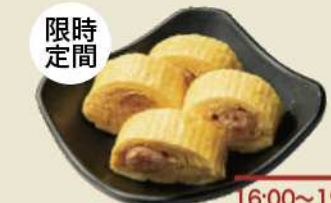
粒立ち抜群のかぼす明太が入った絶品だし巻卵 だし巻き卵 (かぼす明太入り) ¥600