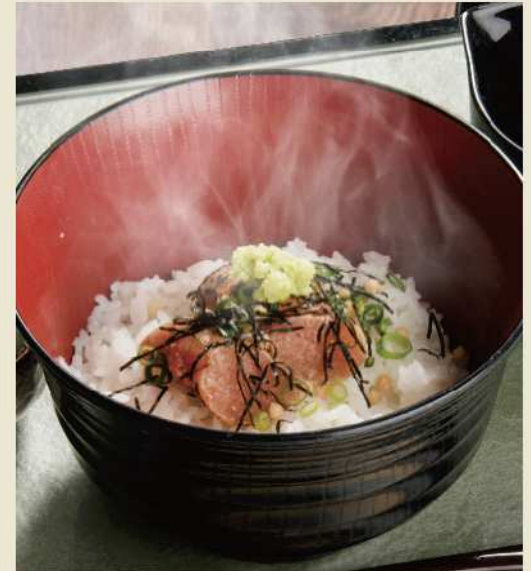
九州名物明太子を爽りました やまや特製炙り明太子茶漬け ¥800