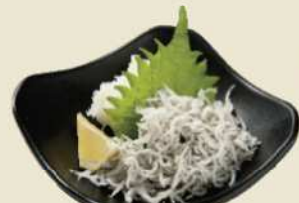
カルシウムたっぷり美味しいちりめん おろしちりめん ¥450