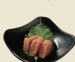
かぼす風味の粒立ち明太子 かぼす明太子 ¥550