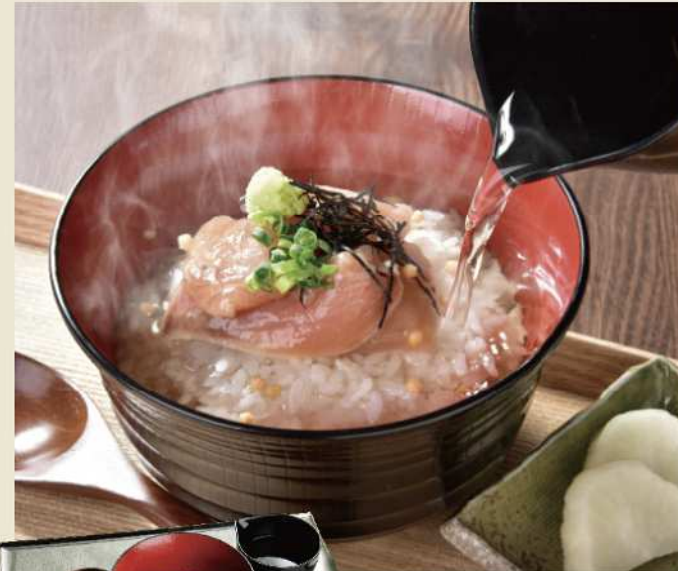
大分郷土料理のお茶漬け プリのりゅうきゅう茶漬け ¥800