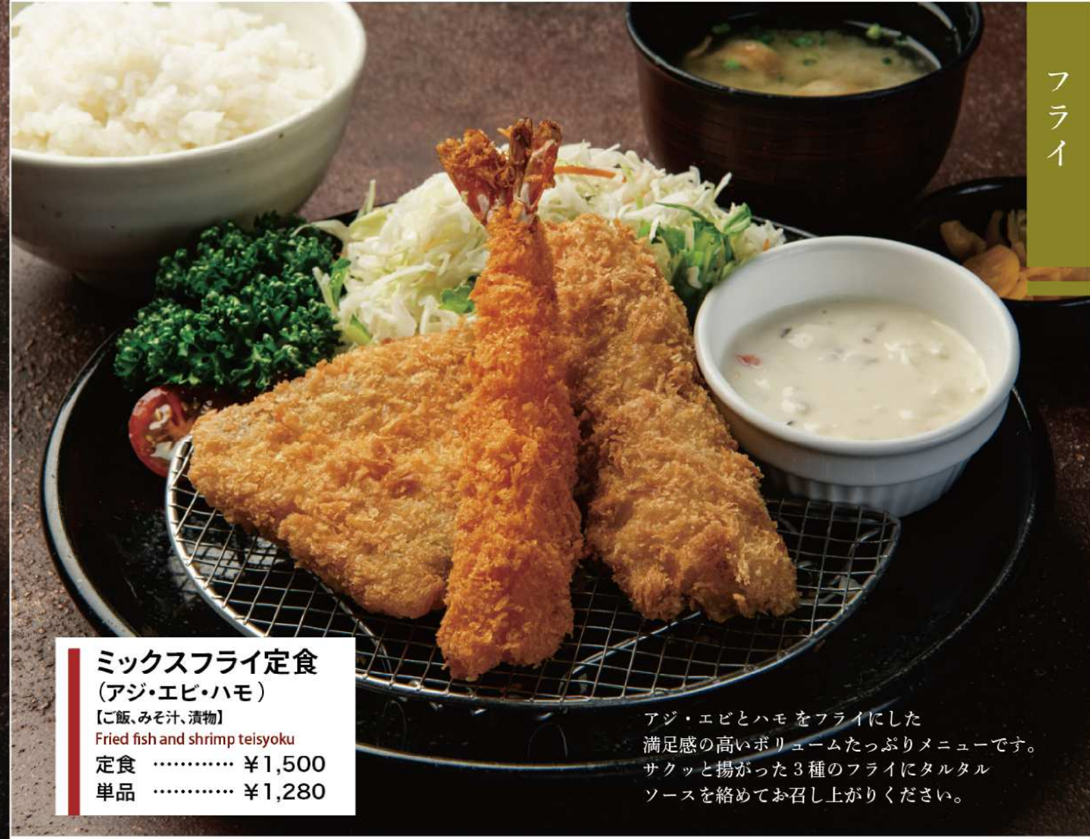
ミックスフライ定食 (アジ・エビ・ハモ) 【ご飯、みそ汁、漬物】 Fried fish and shrimp teisyoku 定食 ..... ¥1,500 単品 ..... ¥1,280

アジ・エビとハモをフライにした満足感の高いボリュームたっぷりメニューです。サクッと揚がった3種のフライにタルタルソースを絡めてお召し上がりください。