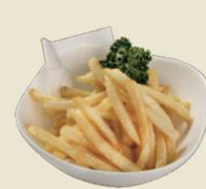
定番のおつまみ、お子様にも大人気 フライドポテト ¥450