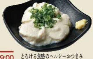
とろける食感のヘルシーおつまみ ざるどうふ ¥500