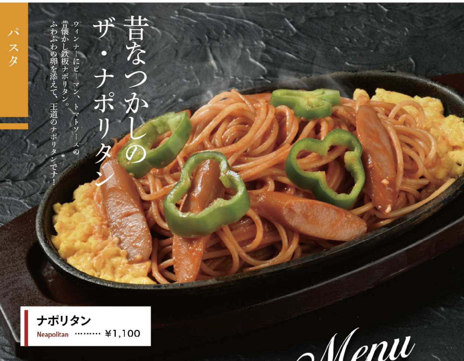
ナポリタン Neapolitan …… ¥1,100

昔なつかしの ザ・ナポリタン ワインナーにピーマン、トマトソースの 昔懐かし鉄板ナポリタン。 ふわふわの卵を添えて、王道のナポリタンです！