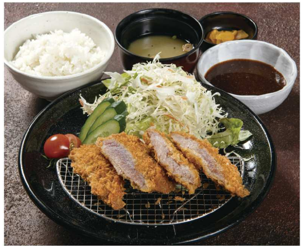
九重夢ポークのヒレかつ定食 【ご飯、みそ汁、漬物】 Kokonoe dream pork fillet cutlet teisyoku 定食 ..... ¥1,450 単品 ..... ¥1,330

大分県産 ポークの旨み 厳しい衛生基準を満たしたSPF豚のヒレカツ。臭みがなくきめ細かい肉質の大分県が誇る九重夢ポークの旨みが詰まった逸品です。