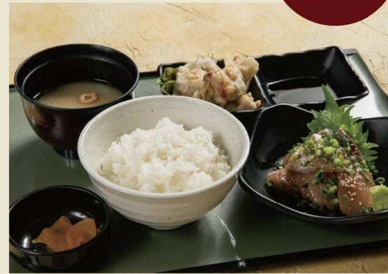
例 プリのりゅうきゅう+とり天おつまみ+ご飯セット