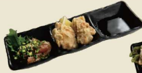
大分名物とり天とりゅうきゅうが一皿に とり天&りゅうきゅう ¥850