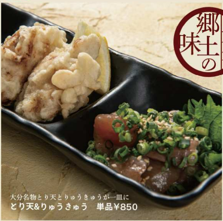
大分名物とり天とりゅうきゅうが一皿に とり天&りゅうきゅう 単品¥850