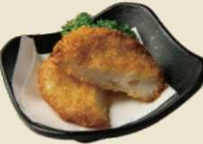
魚のすり身コロッケ 別府ぎょりん ¥400