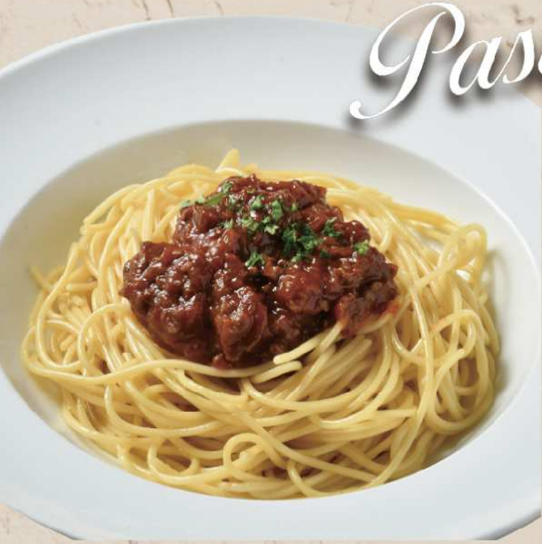
ミートパスタ … ¥1,000 Spaghetti bolognese