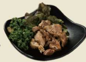
大分銘酒とり冠地鶏一味違う岩塩焼き 冠地鶏の岩塩焼き ¥600