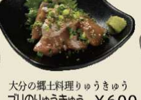
大分の郷土料理りゅうきゅう プリのりゅうきゅう ¥600