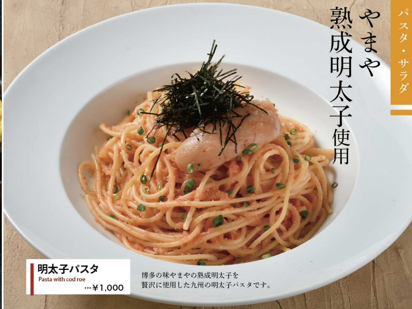
明太子パスタ Pasta with cod roe …¥1,000