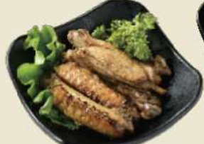
大分銘酒とり冠地鶏一味違う岩塩焼き 冠地鶏手羽中の岩塩焼き ¥500