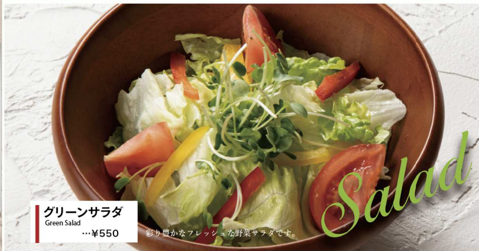
グリーンサラダ Green Salad …¥550