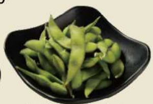
定番のおつまみ!! 枝豆 ¥350