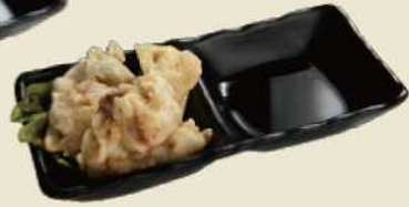
大分庶民の家庭の味 とり天ぶら とり天おつまみ ¥500