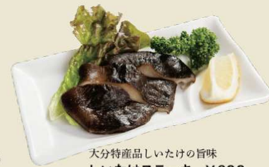
大分特産品しいたけの旨味 しいたけステーキ ¥600