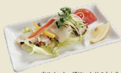
白ワインと一緒にいかがですか？ タコのマリネ ¥850