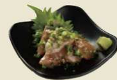
プリのりゅうきゅう ¥600