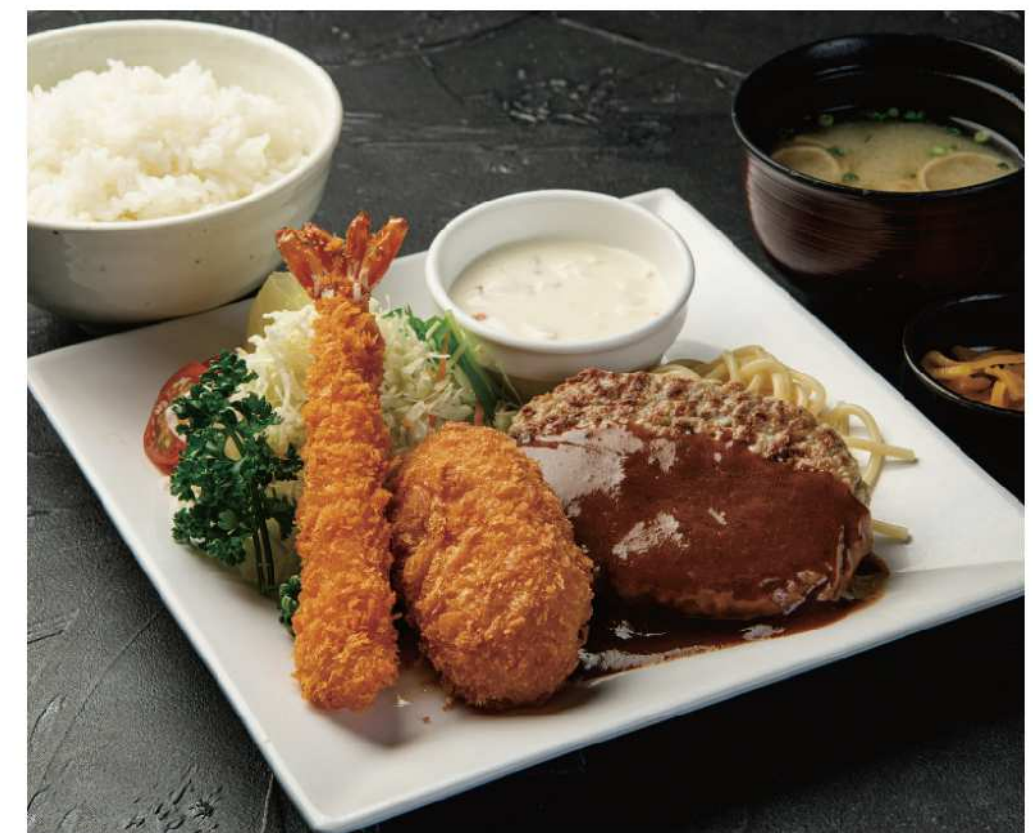
大人のランチ 【ご飯、みそ汁、漬物】 Adult lunch 定食 ..... ¥1,500 単品 ..... ¥1,280

ハンバーグにカニクリームコロッケ、エビフライの嬉しいプレート！ 大人も大満足な洋食ランチセットです。