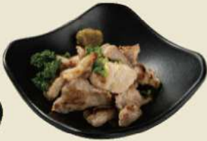
西京味噌の香ばしい風味がたまらない 豚の西京焼き ¥500